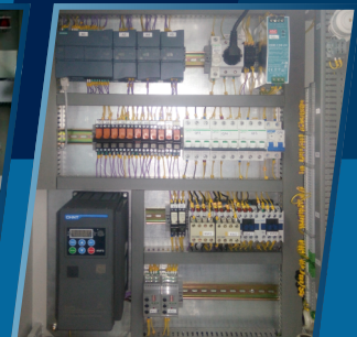
Шафа ПЛК «Азотна станція АМВН 1,7-1,4 У1» на замовлення БГПЗ