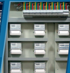
Щит поверховий на замовлення ЖК Dominion Business Park